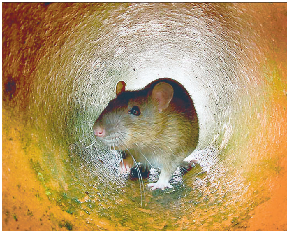
△ UØNSKET. Jo længere væk fra husholdningerne, man kan holde rotterne, for eksempel med en rottespærre, des mindre føde er der, som de kan leve af i kloakrørene.

»Jeg mener, vi kan være foruden det beløb, hvis vi installerer rottespærren,« siger han og forklarer, at det handler om at give rotterne dårlige levebetingelser for derved at forebygge frem for at slå dem ned